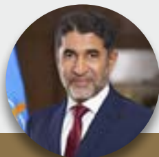
АХМАД АЛЬ МАНДХАРИ

РЕГИОНАЛЬНЫЙ ДИРЕКТОР WHO ДЛЯ СТРАН ВОСТОЧНОГО СРЕДИЗЕМНОМОРЬЯ